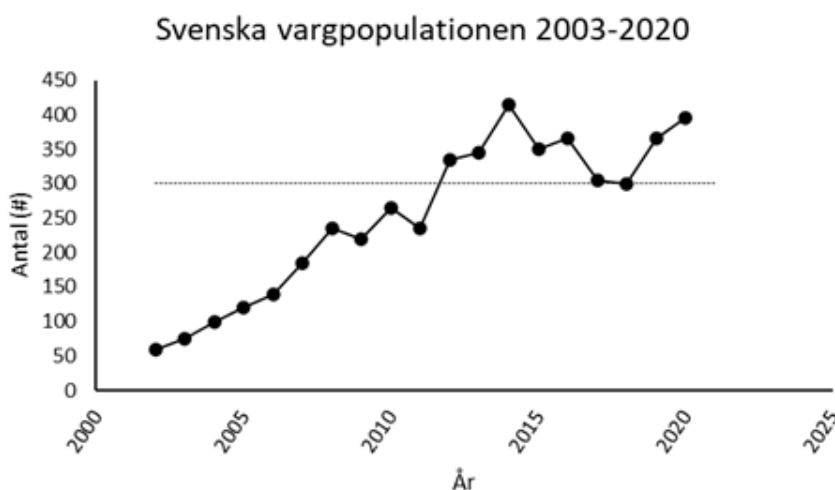
Figur 2. Utveckling av den svenska vargstammen 2003-2021 12 .

Den inventerade populationsstorleken som fastställdes den 1 juni 2021 redovisar att antalet vargar vintern 2020/2021 uppgick till 395 (95% CI = 312-513) individer. I den levererade beskattningsmodellen anges att populationsstorleken för den svenska delpopulationen beräknas att uppgå till 403 (289 – 539; 90% KI) individer den 1 oktober 2021 där hänsyn har tagits till det uttag på 49 individer som har skett under perioden 1 oktober 2020 till 30 april 2021.